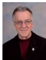
Aldé Bellavance Quartier Sud, siège #1