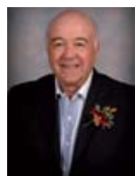
Marcel Fontaine Quartier Centre, siège #2