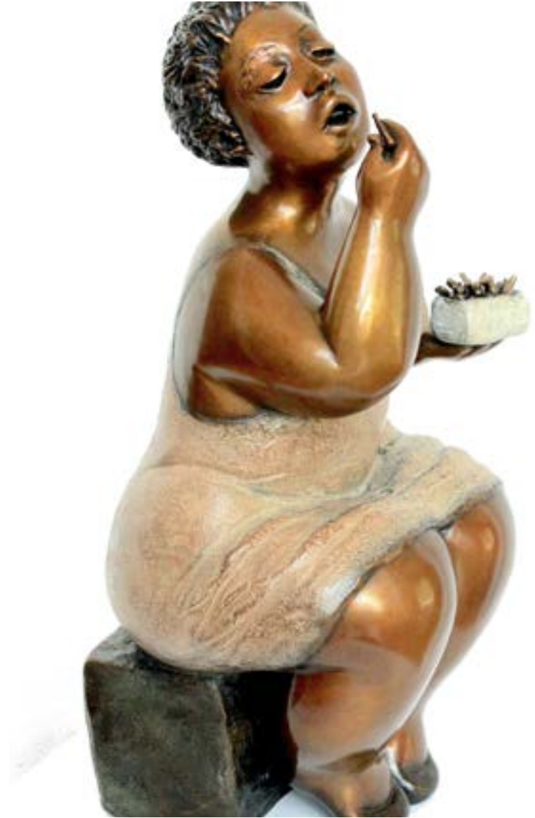
Rose-Aimée Bélanger, Mon âme pour une frite, 2021, bronze