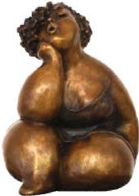
Rose-Aimée Bélanger, Gabrielle, 2009, bronze