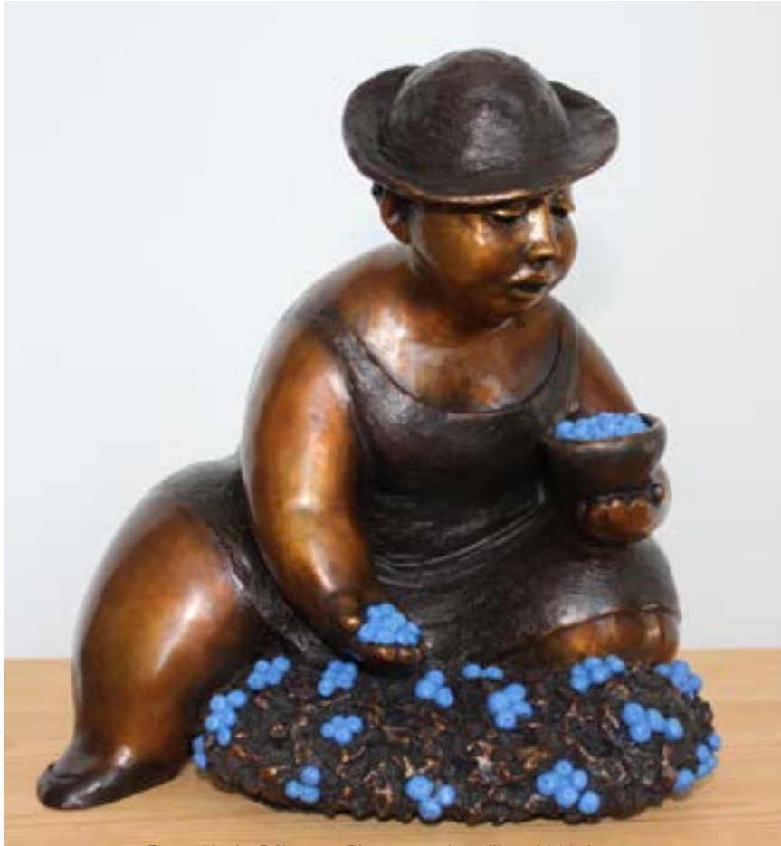
Rose-Aimée Bélanger, Bleuets sur la colline, 2016, bronze

Cette exposition tente, à travers des carnets de dessins, des esquisses d'argile, des photos d'œuvres aujourd'hui dispersées aux quatre vents, et, bien sûr, une cinquantaine de grès et de bronzes, de faire affleurer les réalités des deux Témiscamingues, que Rose-Aimée Bélanger a encapsulé dans une œuvre prolifique, qui compterait près d'un millier de pièces.